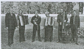
Das Quintett „Como Pantera“

Der Eintritt kostet 10 Euro, im Vorverkauf 8 Euro.