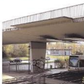
Offene Fragen gibt es bei der Erneuerung der Brücke in Ostorf.