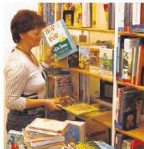
Die Strukturen der Bibliotheken stehen auf dem Prüfstand.