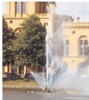
Klärungsbedarf sieht das Land bei der Pfaffenteich-Fontäne.