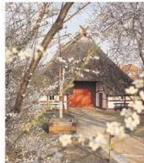
Steht das Volkskundemuseum in Mueß vielleicht vor dem Aus?