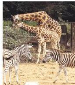
Bleibt der renommierte Zoo in seiner Vielfalt erhalten?