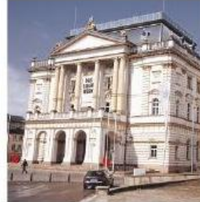
Sogar eine Schließung des Theaters steht zur Diskussion.