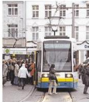
Streckenstilllegungen beim Nahverkehr sind kein Tabu.